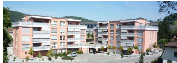
„Wohnen im Alter“ in Reiden als Referenzobjekt

Es sollen zwei Mehrfamilienhäuser mit Tiefgarage realisiert werden. Im Parterre befinden sich jeweils die Gemeinschaftsräume sowie die Räumlichkeiten für die Mehrnutzung (z.B. Spitex). Es sind grosszügige 1 ½ bis 3 - Zimmerwohnungen mit grossem Balkon geplant.